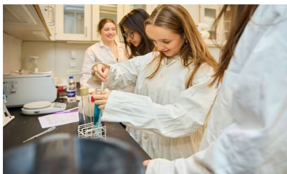
Foto 3 Gymnasieelever tester undervisningsmateriale til biokemi om tang.

På nationalt plan har projektet Haven i Havet 2 nået ud til undervisning om regenerativ havdyrkning til tusindvis af skoleelever i hele landet. Ligesom der er udviklet undervisningsmateriale målrettet gymnasier og kokkeuddannelsen. Hvilket lægger grunden for at udbrede kendskabet til vores lokale råvarer og regenerativ dyrkning endnu mere.