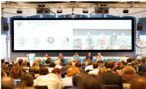
Foto 4 Havhøst deltager i paneldebat hos European Blue Forum om The European Ocean Pact den 5.

Havhøsts engagement på den europæiske scene har også i 2025 været betydeligt. To projekter, Cool Blue og Cool Blue Baltic, har gjort det muligt for Havhøst at dele erfaringer og tale havdyrkningens sag i en europæisk kontekst – fordi det også er vigtigt for udviklingen i Danmark. Bl.a. har Havhøst deltaget i udviklingen af The European Ocean Pact med henblik på at sikre fokus på havdyrkning i EU fremtidige anvendelse af havet.