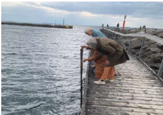
Foto 1 Deltagere på netværksmødet for maritime